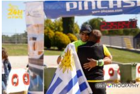
Final de la vuelta

Un momento muy emotivo embargó a todo el público cuando los equipos se dispusieron a dar una vuelta completa para después fundirse en un abrazo. Esto es algo que no se suele ver en este tipo de prácticas deportivas pero que deja a la vista la humanidad de los deportistas. La práctica del deporte y la competición deja un buen sabor de boca si todos participan unidos.